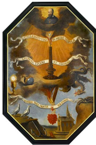
Allégorie de l'apothéose de F. de Sales - Huile sur lin, 1665