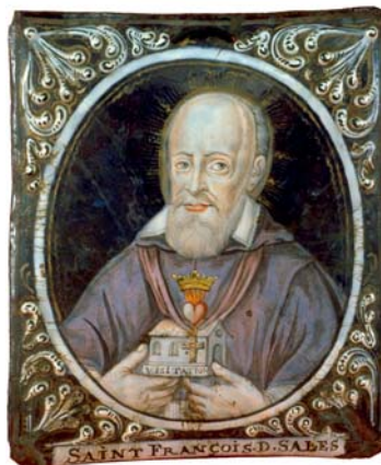
F. de Sales Fondateur de la Visitation – émail – vers 1650