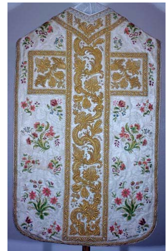
Chasuble de J de Chantal Avignon – fils d'or - 1751