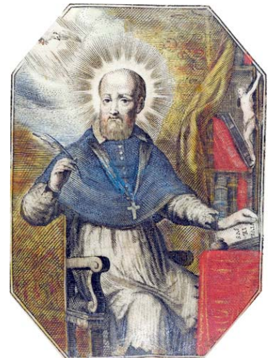
François de Sales à son bureau → Image aquarellée – Fin XVII°