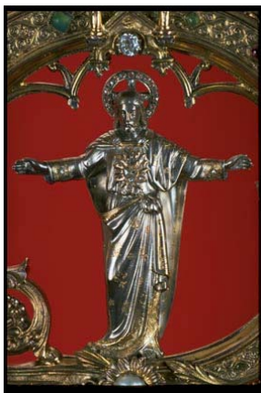
Crosse du cardinal Perraud Détail – argent, diamants - 1874