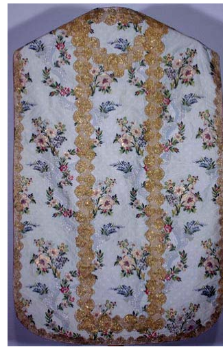
Chasuble – soierie italienne Fin XVIII e