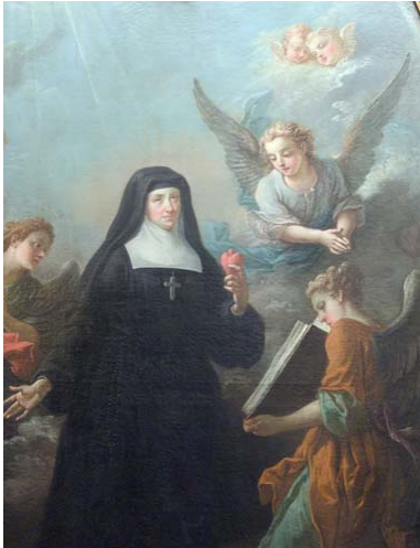
Apothéose de sainte Jeanne de Chantal. Ateliers J. Restout - 1752

Dès que les procès en béatification puis canonisation de saint François de Sales et sainte Jeanne de Chantal établirent la sainteté des fondateurs de leur ordre, les visitandines commencèrent à préparer et organiser des festivités.