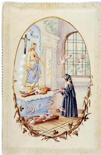
<-- Le Sacré-Cœur et la visitandine Image aquarellée Début XX°