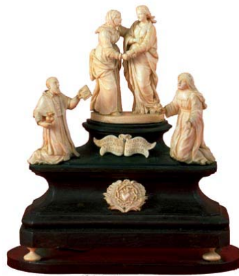
La Visitation et les saints fondateurs Bois noir, ivoire – Milieu XIX e

Le développement de cette congrégation fut considérable au XVII e siècle en France, au XVIII e siècle en Europe, au XIX e siècle en Amérique. Ainsi les monastères de l'ordre de la Visitation sont présents dans le Monde entier (sauf en Océanie). L'ordre est très actif en Afrique et en Amérique du Sud.