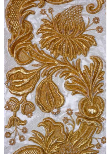
Chasuble de J de Chantal - détail Le Puy-en-Velay – fils d'or - 1751