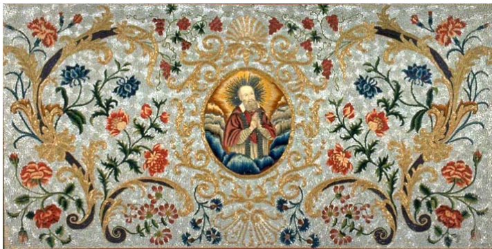
Parement de perles de la canonisation Perles de verre, fils de soie - 1662