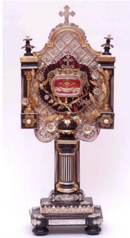
Monstrance de la canonisation de Marguerite Marie Ebène, argent, écaille de tortue - 1920