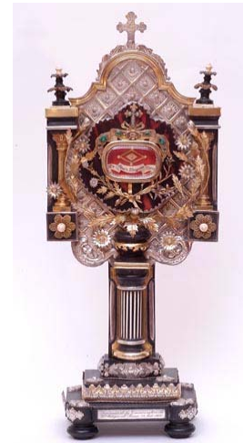
Monstrance de Marguerite- Marie – argent, écaille - 1920