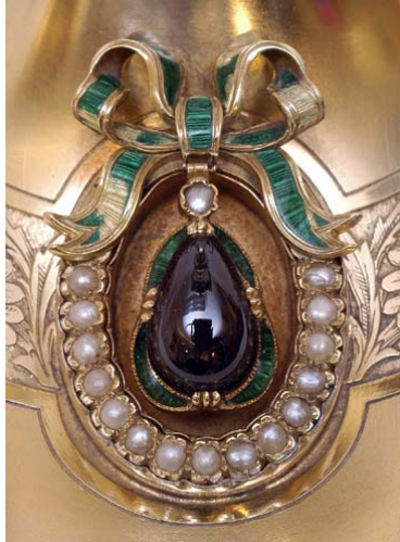
Ciboire aux bijoux - détail Grenat, perles, émaux - 1864