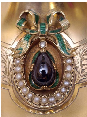
Ciboire orné de bijoux - détail Grenat, perles, émaux, 1920

Service Communication de la Ville de Moulins 12, place de l'Hôtel de Ville à Moulins Tél : 04 70 48 50 27