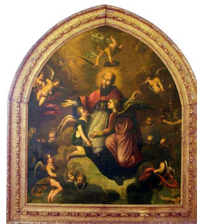
Apothéose de F. de Sales Huile sur toile - 1665