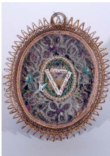
Reliquaire Soleil des fondateurs Papiers roules, verre – XVIII e