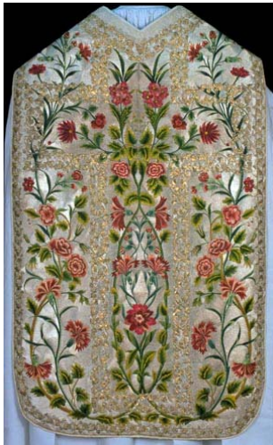
Chasuble aux œillets Fils d'argent, de soie - Poitiers - 1666