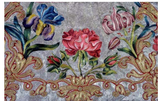
Nappe de communion – détail Argent, or, soie - 1767