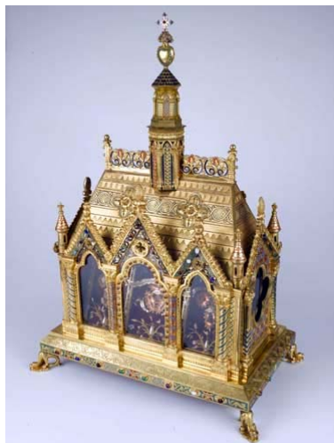
Chasse de Marguerite-Marie Bronze doré émaillé Poussièlgue-Rusant, 1864

Tout concorde pour que les cités s'organisent et participent aux « Festivités ». De plus, comme cent vingt des plus grandes villes de France et de Savoie accueillent déjà un monastère de la Visitation, ces communautés constituent la source et le point central de l'engouement populaire qui va se manifester, générant un foisonnement des célébrations partout en France. Depuis sa fondation à Annecy, l'ordre de la Visitation a énormément recruté dans les milieux nobles et bourgeois, et tous se sentent motivés pour participer aux manifestations, les uns par un don, les autres par le prêt de mobilier ou de moyens logistiques... On organisa des carrousels, « on alluma le feu d'artifice, dont la machine estait carrée, en forme de portique. Sur le milieu estait l'Autel du Soleil et au-dessus un phénix aux aisles estendues. Un rayon partit d'un soleil placé au plus haut du clocher de la Métropolitaine pour mettre le feu à ce bûcher... . »