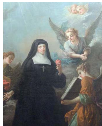
Apothéose de J. de Chantal Atelier Restout - 1752