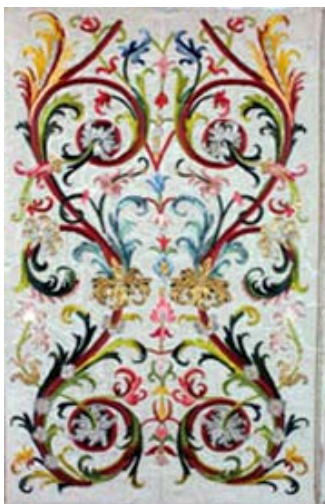
Parement de crédence Lin, fils de soie - 1662