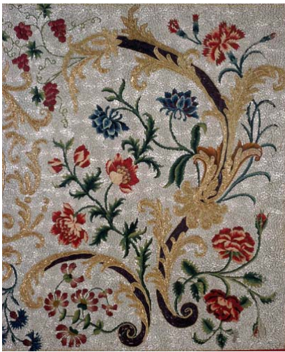
Parement de perles - détail Perles de verre, fils de soie, 1662

Ouvert du mardi au samedi de 10h à 12h et de 14h à 18h Le dimanche de 14h à 18h Entrée gratuite