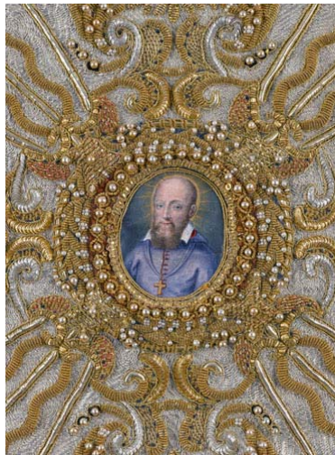
Voile de calice – détail Or, argent, perles - 1665