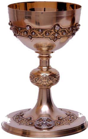
Calice aux diamants Argent, diamants - 1919