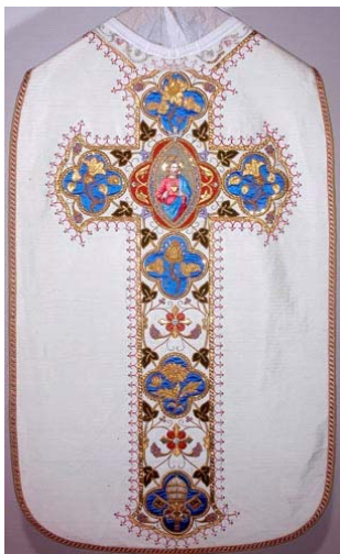
Chasuble néogothique aux cailloux du Rhin (et détails) Fils d'or et soies, - 1857