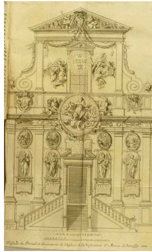
Décor de la Visitation d'Annecy pour les Fêtes de 1665