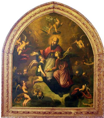
Apothéose de sainte F. de Sales Robin - 1665

L'intérieur des édifices pouvait être le lieu de mises en scène sophistiquées, notamment par le jeu des lumières et des reflets, offerts par les centaines de bougies, les chandeliers et les bras de lumière d'argent, les vases de même métal, les plaques de vermeil et les miroirs savamment disposés, l'or et l'argent des parements d'autel, et ceux des crédences et des dais. À Montferrand, en 1667, la description de tout cet appareil est éloquent : « Sur le milieu de la Machine estait le Trône destiné au S. Sacrement, le fond était une glace de Miroir, avec sa bordure d'argent et deux Anges d'argent, qui avec des festons d'argent tournés en enroulements, faisaient une espèce d'arceau sur ce miroir, pour en changer la figure. Deux autres Anges d'argent, avançaient sur le devant, soutenaient une couronne de pierreries, estimées plus de cent mil écus . »