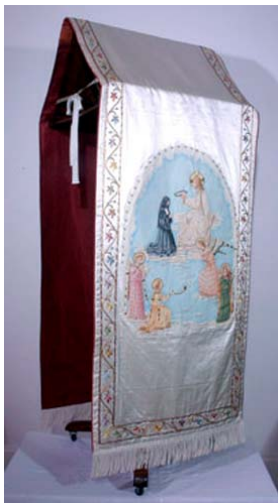
Voile de pupitre peint 1920