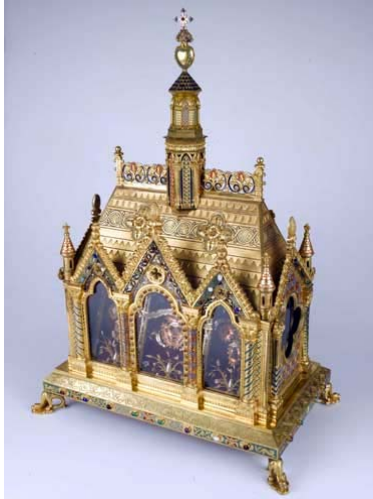
Châsse de Marguerite-Marie, Bronze doré émaillé - 1864

Les visuels des œuvres listées ci-dessous sont disponibles pendant la durée de l'exposition « Splendeurs dévoilées » et dans le cadre de la promotion de l'exposition. Pour tout autre utilisation, merci de demander l'autorisation au Musée de la Visitation.