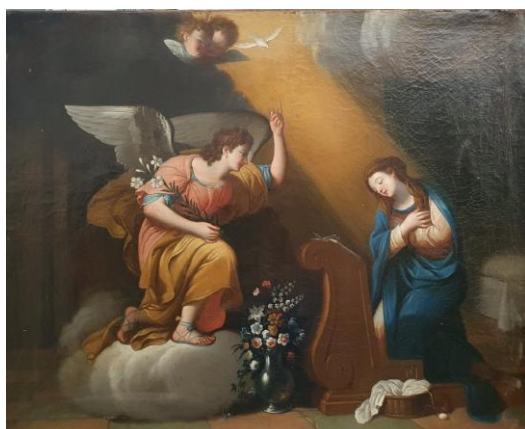
L'Annonciation, huile sur toile, V. La Roche-sur-Yon, 17 e siècle