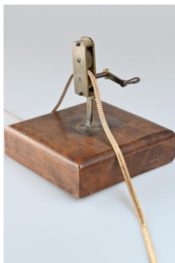
Machine à froncer de marque Clausse, fin du 19 e siècle, V. Paray-le-Monial, M.V.

Ainsi, avec très peu de moyens, les religieuses développent un vocabulaire décoratif d'une étonnante diversité.