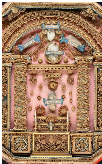
V. Romans (?), autel baroque, centre d'un cadre reliquaire, papier roulés, début 18 e siècle, M.V.

Par ailleurs, plusieurs ensembles sont conçus en duo, dans deux cadres identiques, les compositions sont alors symétriques. Ces paires étaient destinées à encadrer une croix ou une statue sur un autel.