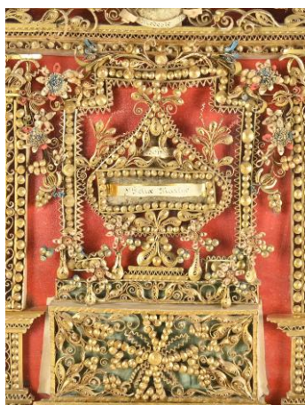
V. Paris, détail de l'autel de saint Félix, 18 e siècle, M.V.