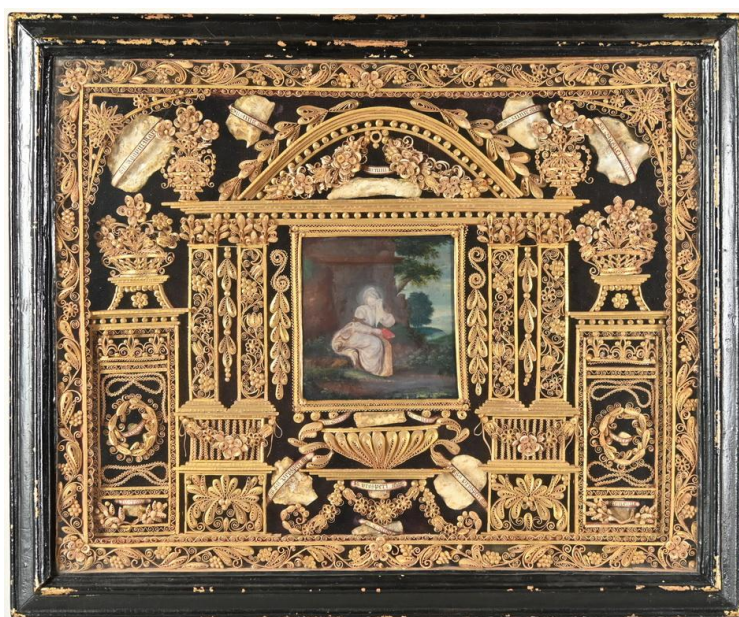
V. Paris, Retable d'église, 18 e siècle, M.V.