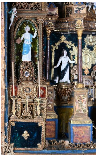
Autels des saints Mattieu et Jean, détail d'une composition, bois, papier, verroterie, verre filé, fin 18 e siècle, M.V.