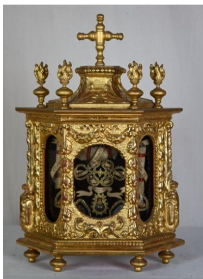
V. Poitiers, Châsse reliquaire aux pots-à-feu, bois doré, vers 1700, V. Nevers, M. V.

Attribuer une œuvre à un couvent précis reste difficile. Par ailleurs, beaucoup d'œuvres ont été modifiées au fil du temps : restaurations, ajouts de nouvelles reliques, adaptation aux dévotions du moment. A la Visitation par exemple, beaucoup de compositions ont été adaptées après la béatification de Marguerite-Marie Alacoque en 1864. Ces recompositions rendent la datation complexe mais révèlent un art vivant, continuellement réinventé.