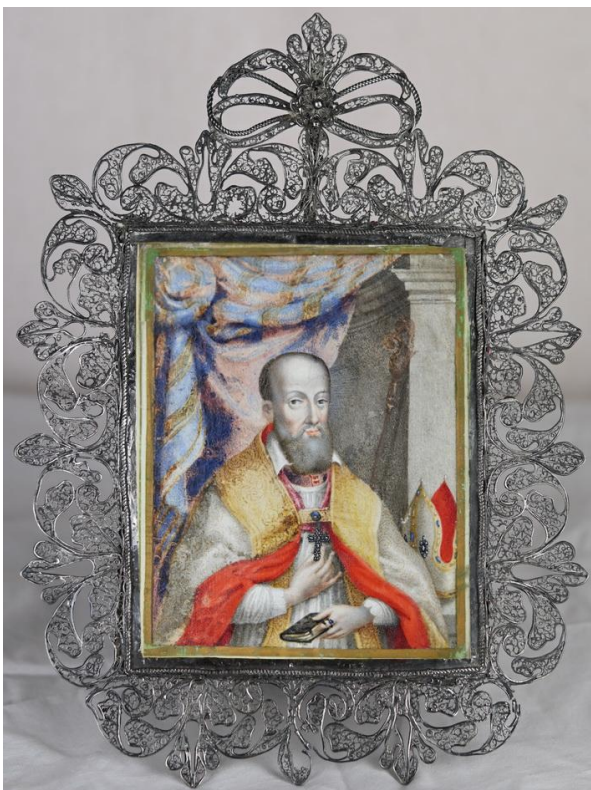
François de Sales, peinture sur vélin, filigrane d'argent, fin du 17 e ou début du 18 e siècle, V. Paris, M. V.

Béatifié en 1661, canonisé en 1665, il est déclaré docteur de l'Église en 1877.