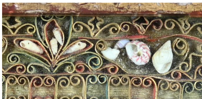
Coquillages incrustés dans une composition, 18 e siècle, M. V.