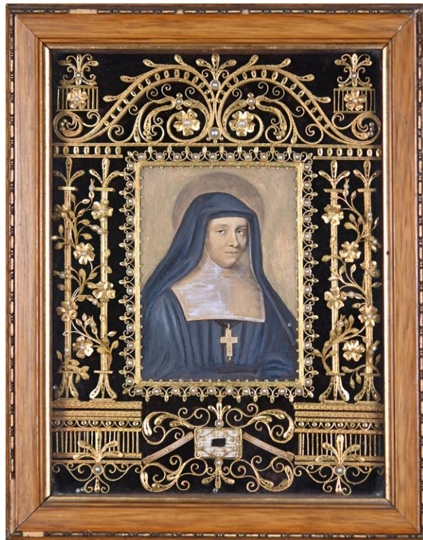
V. Nantes, retable de sainte Jeanne-Françoise de Chantal, papiers roulés, peinture sur papier, perles de verre, début du 20 e siècle, M. V.

Béatifiée en 1751, Jeanne-Françoise est canonisée en 1767.