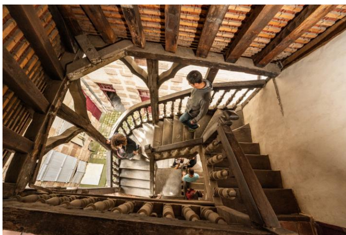
Escalier de chêne Musée, 17 e siècle

L'intérêt de ces collections réside non seulement dans leur richesse, leur état de conservation exceptionnel et leur caractère inédit, mais aussi dans les informations précieuses qui accompagnent les objets. Les dix-neuf ouvrages publiés depuis 2007 en témoignent. Grâce à un travail de recherche continu, notamment dans ses archives, le musée de la Visitation a recueilli des renseignements dont on dispose rarement pour des pièces similaires conservées dans des collections privées ou publiques : datation précise, auteur, donateur, commanditaire, origine géographique, lieux successifs de conservation, anecdotes... Ces informations sont entièrement informatisées et regroupées dans une base de données baptisée « Philothée », qui relie l'histoire des objets à la vie des monastères à travers les siècles.