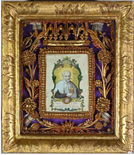
V. Poitiers, saint Vincent de Paul couronné, papiers roulés, estampe sur papier rehaussée, seconde moitié du 19 e siècle, V. Nevers, M.V.

Pourtant, des similitudes de style ou de dimensions suggèrent l'existence d'ateliers qui produisent de nombreux cadres analogues. L'exposition met en valeur par exemple quelques créations des visitandines de Poitiers de la seconde moitié du 19 ème siècle. L'une d'elle, aujourd'hui anonyme, laisse une véritable « signature » stylistique dans ses tableaux de dévotion. L'autrice a utilisé des encadrements rectangulaires de petite taille pour créer des paires. Elle a parfois placé en leur centre des jolies images peintes. Pour d'autres, elle a exécuté des figures représentant les monogrammes de Jésus et Marie (IHS et MA) ou encore la croix chargée des instruments de la Passion. Mais, dans tous les cas, ses compositions étaient surmontées d'une belle et large couronne héraldique fermée.