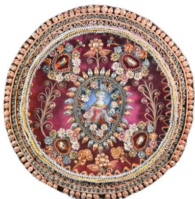
Médaille de sainte Christine, papier, plaque émaillée, 18 e siècle

Ces créations sont aussi changeantes selon l'angle du regard. Le papier utilisé, doré sur tranche, peut-être de différentes teintes. Pour autant, les bandes étant fixées perpendiculairement au fond, les décors semblent dorés lorsqu'on les voit de face. Leurs coloris ne se révèlent véritablement que lorsqu'on les admire de côté ainsi que dans les pétales très épanouis de certaines fleurs. Les compositions les plus agréables sont souvent celles qui associent plusieurs nuances.