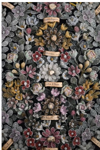
Composition de fleurs polychromes ornées de reliques, éléments métalliques, fin 19 e siècle, V. Chambéry, M.V.

Le papier, matériau humble, se mêle ainsi au métal précieux pour créer des œuvres lumineuses, à la frontière de l'orfèvrerie et de l'art textile.