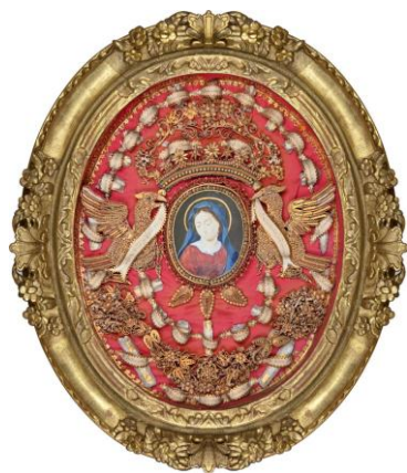
La Vierge aux aigles, papiers roulés, 18 e siècle, V. Caen, M.V.

Trésors de papier rassemble près de deux cents œuvres réalisées à partir de simples bandelettes de papier enroulées, pliées, parfois gaufrées, puis collées sur la tranche. De ce matériau modeste naissent des compositions d'une grande richesse : motifs floraux, arabesques, aux dorures éclatantes et aux jeux de couleurs subtils.