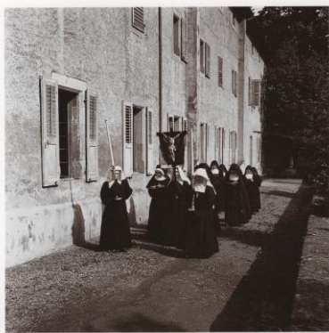
Procession des visitandines de Thonon, mai 1959.