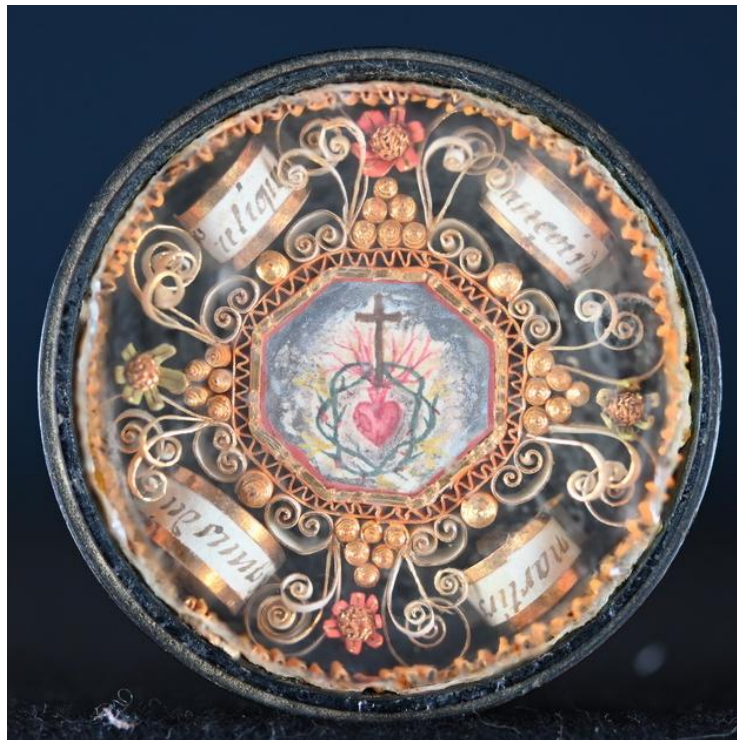
Petite boîte reliquaire au Cœur du Christ, peinture sur papier, papiers roulés, bois, 18 e siècle

Elle meurt à Paray-le-Monial le 17 octobre 1690. Béatifiée en 1864, elle est canonisée en 1920.