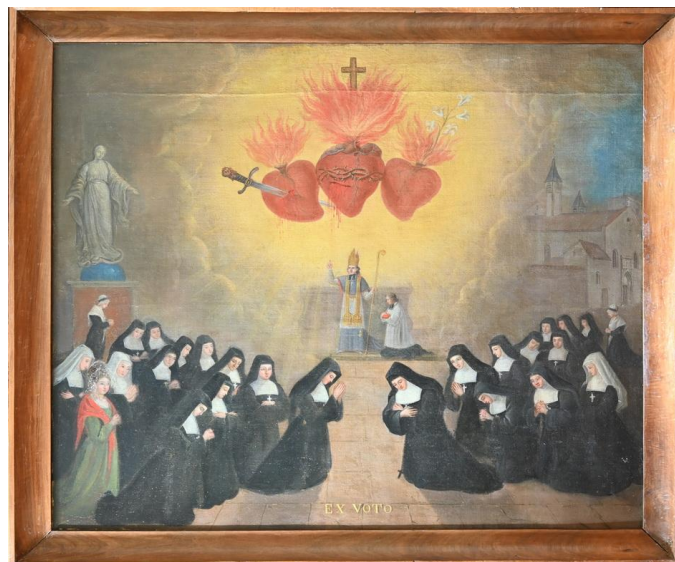
Consécration des visitandines de Mâcon aux cœurs de la Sainte Famille, huile sur toile, 1834

Le développement de la Visitation est considérable au 17 e siècle en France, au siècle suivant en Europe, puis au 19 e siècle en Amérique. Ainsi, les monastères de cette congrégation sont présents dans le monde entier, l'Ordre étant très actif en Afrique et en Amérique du Sud.