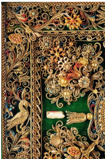
Composition aux bouquets et aux oiseaux, 18 e siècle, V. Troyes, M.V.

Stylisées par la contrainte du papier roulé, les variétés sont rarement identifiables avec certitude. Il ne s'agit pas de botanique, mais d'une flore sacrée miniature. Pour les religieuses, chaque pétale devient louange : la beauté de la création renvoie au Créateur, tandis que la fragilité de la fleur rappelle la brièveté de la vie et la promesse de la Résurrection.