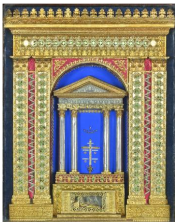
Calendrier reliquaire romain, 19 e siècle, V. Waldron (G.B.), M.V.