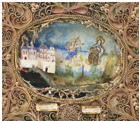
La Transverbération de Thérèse d'Avila, papier, végétaux, 18 e siècle, V. Paray-le-Monial, M. V.