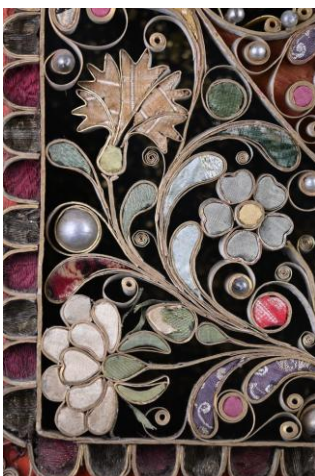
Céillet et pivoine, détail d'un tableau, milieu 19 e siècle, V. Salò (Italie), M. V.

Avec Trésors de papiers , le musée de la Visitation met en lumière un patrimoine méconnu, à la croisée de l'art, de l'artisanat et de la spiritualité. Une exposition sensible et spectaculaire qui révèle, derrière la délicatesse du papier, la force d'une vie consacrée.