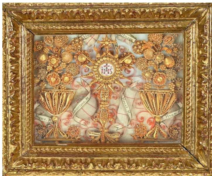
V. Troyes (?), exposition eucharistique destinée, papiers roulés, seconde moitié du 19 e siècle, M. V.