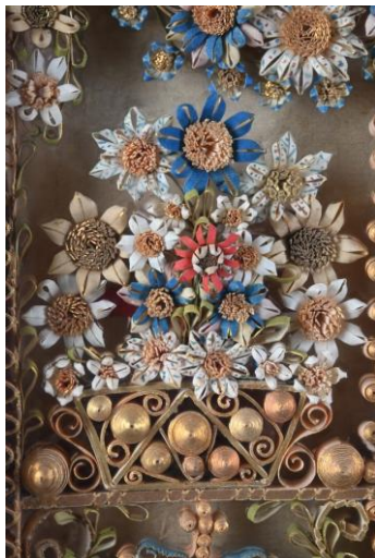
Bouquet de fleurs, détail d'une composition, papiers roulés, papiers pliés et pinceautés, début du 18e siècle, collection J.-L. Quênôt, M. V.

On voit parfois des fleurs de très petite taille dont les pétales mesurent moins de 1 millimètre. Elles sont obtenues en travaillant une bande dans laquelle on a coupé des lamelles sur environ la moitié de la hauteur, à l'aide de ciseaux ou d'un canif. Après avoir embobiné, serré et collé cette bande, il suffit d'écarter les lamelles vers l'extérieur avec le doigt pour voir apparaître une fleur et ses dizaines de pétales. Les fleurs les plus fines font penser à des pompons de laine.