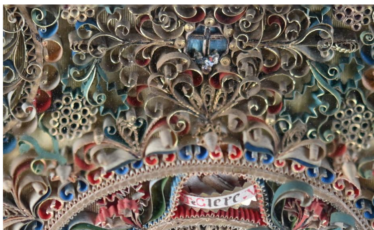
Vue de côté d'une composition en papiers polychromes, 18 e siècle, collection J.-L. Quénou, M.V.